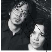
EL CIELO, Ciudad de México, México