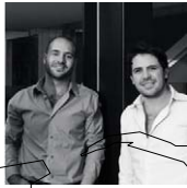
DCPR ARQUITECTOS, Ciudad de México, México