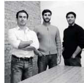
FGMF Sao Paulo, Brasil