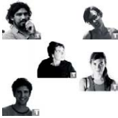
GRUPO TALCA, Talca, Chile