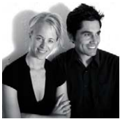
PEZO VON ELLRICHSHAUSEN Concepción, Chile