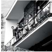
GONZALO DIEZ ARQUITECTOS Quito, Ecuador