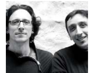
GUALANO/GUALANO ARQUITECTOS Montevideo, Uruguay