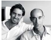
DIEGUEZ FRIDMAN ARQUITECTOS Buenos Aires, Argentina