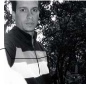
CAMILO RESTREPO Medellín, Colombia PLAN B Bogotá, Colombia