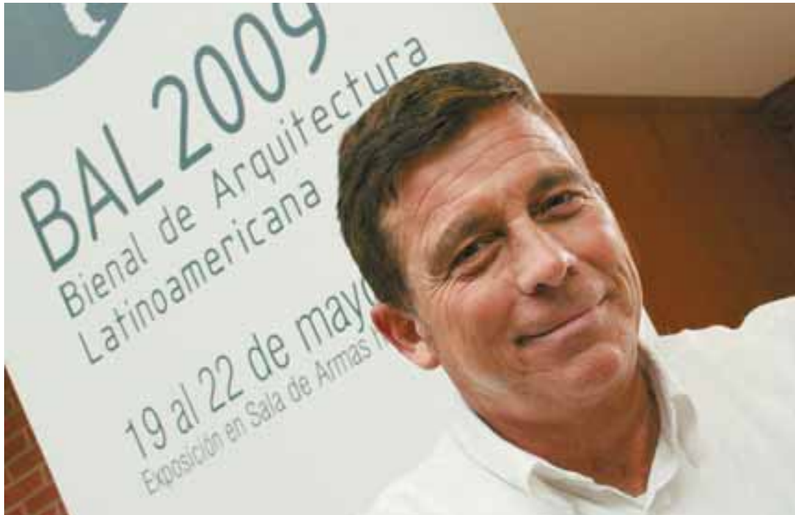
Alberto Campo Baeza, ayer, en la Escuela de Arquitectura de la Universidad de Navarra.