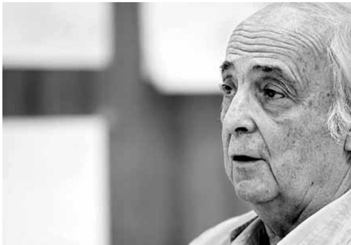
El catalán Manuel de Solà-Morales fue Premio Nacional de Urbanismo en 1983.

Precisamente por ese interés que suscita la arquitectura, los edificios se convierten fácilmente hoy en iconos de publicidad de lo que sea, de una institución, de un banco, de una firma comercial, o en la publicidad